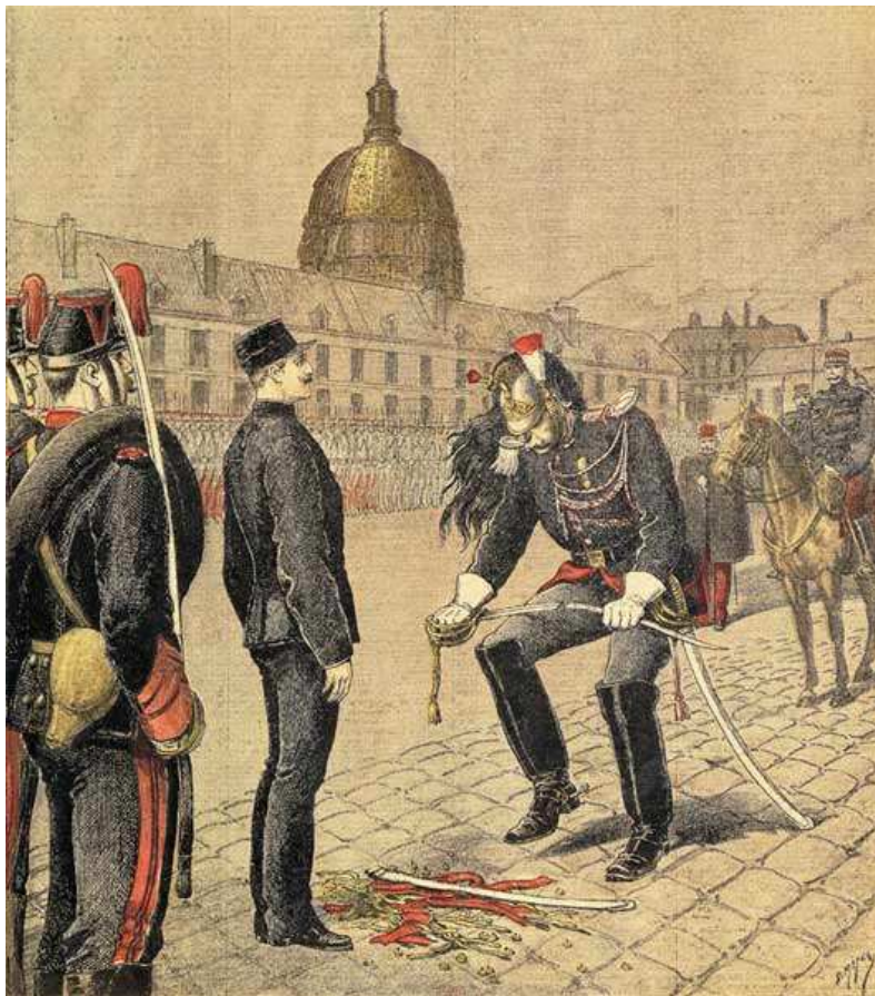
Dégradation de Dreyfus

En 1894, Zola prend la défense du capitaine Dreyfus accusé injustement d'espionnage en faveur de l'Allemagne. A l'occasion de la dégradation publique de Dreyfus, il va publier dans le journal "L'Aurore" une lettre intitulée " J'accuse " afin d'aider Dreyfus.