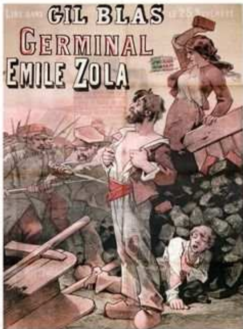
« Germinal »