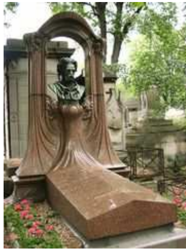
Tombe d'Emile Zola

Et pour finir, il meurt asphyxié, chez lui, à cause d'une cheminée bloquée, dans la nuit du 28-29 septembre 1902, à l'âge de 62 ans. Il fut enterré au cimetière de Montmartre à Paris.