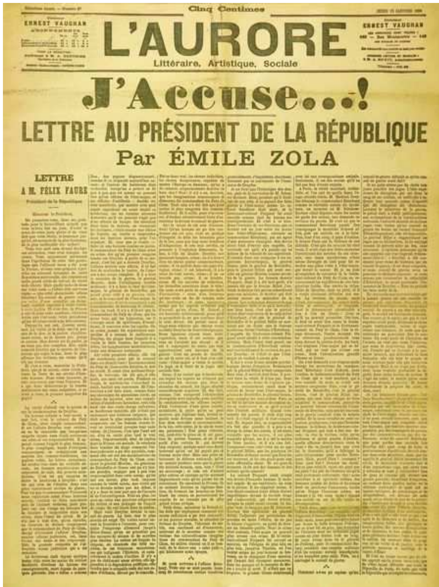
"J'accuse" de Emile Zola défendant le capitaine Dreyfus