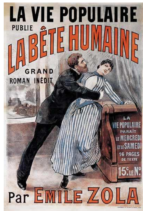
« La Bête Humaine »